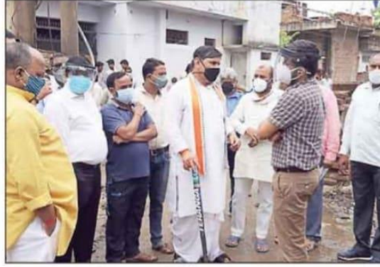
नाले का जायजा लेते विधायक व अन्य अफसर